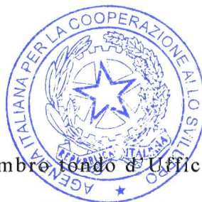
Timbro fondo d'Ufficio

IL PRESENTE AVVISO E' STATO AFFISSO ALLA BACHECA DI QUESTA SEDE AICS DI LA PAZ IL GIORNO 03.03.2017 E NELLA BACHECA DELL'AMBASCIATA D'ITALIA A LA PAZ.