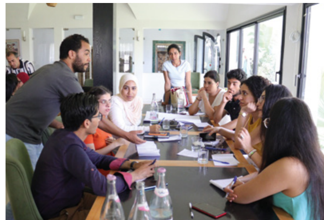
Actividades de la Cooperación Italiana en Túnez