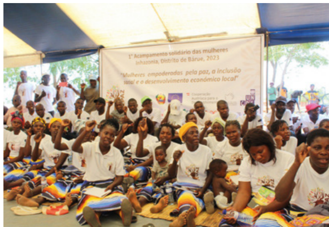
Actividades de la Cooperación Italiana en Mozambique.