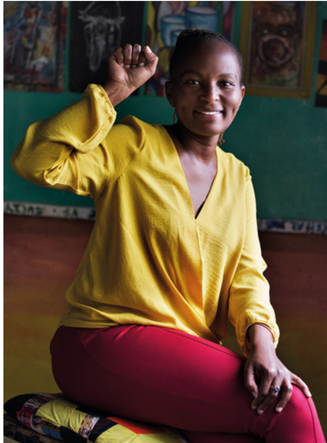
Actividades de la Cooperación Italiana en Kenia