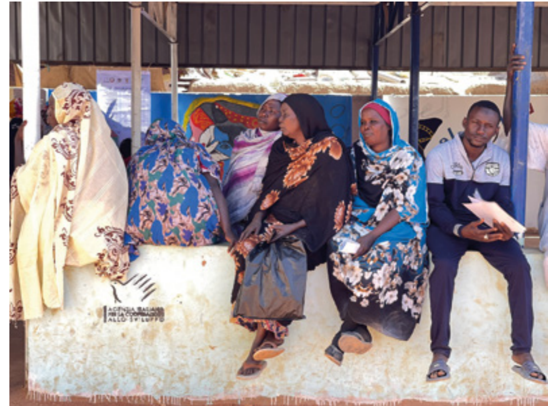
Actividades de la Cooperación Italiana en Sudan

ANEXO 4. HERRAMIENTAS DE RECOPIACIÓN DE DATOS PARA EL ANÁLISIS DE GÉNERO.