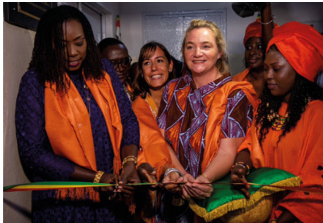
Actividades de la Cooperación Italiana en Senegal