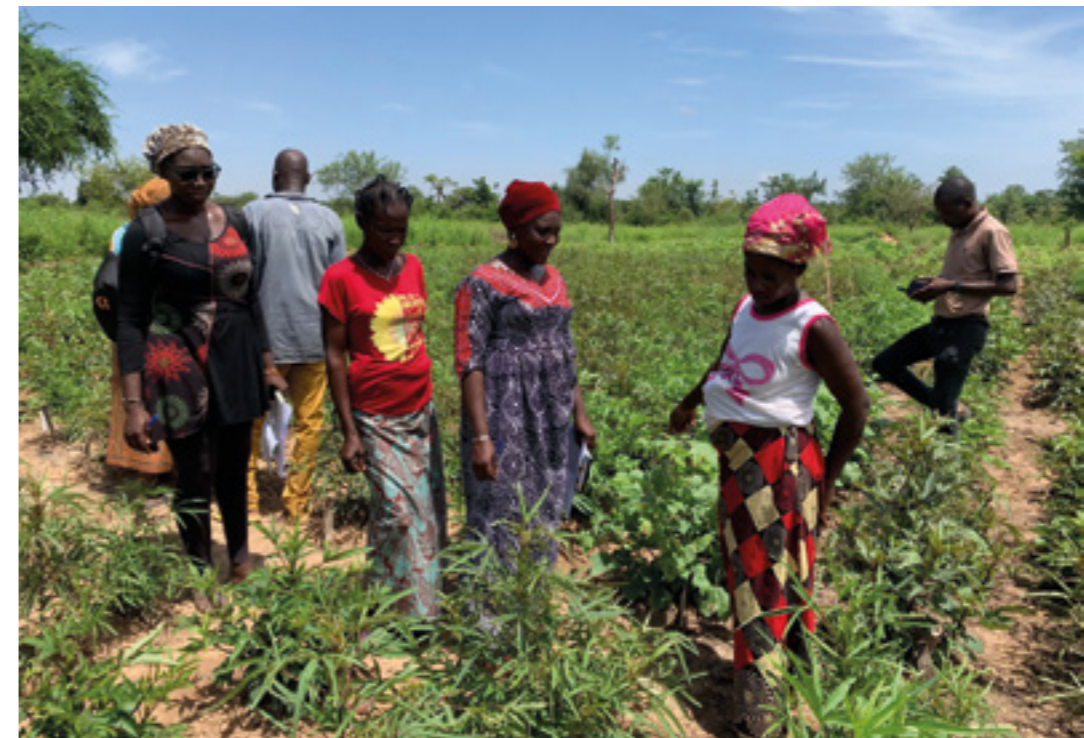
Actividades de la Cooperación Italiana en Burkina Faso