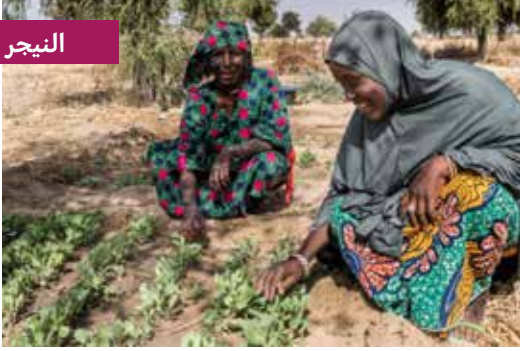
مشروع التعاون الإيطالي في النيجر.