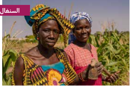
مشروع التعاون الإيطالي في السنغال.