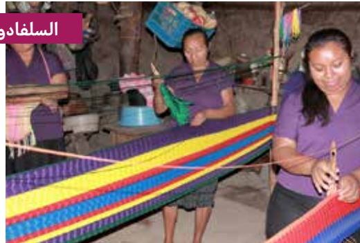
مشروع التعاون الإيطالي في السلفادور.