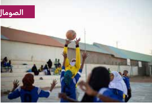
مشروع التعاون الإيطالي في الصومال. صورة صندوق الأمم المتحدة للسكان