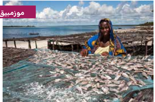
الصيد نشاط أساسي للكتفاء الذاتي وللتجارة في المناطق الساحلية من البلاد. تصوير لويجي كارتا، ٢٠١٧.

تم إعداد هذه الوثيقة من قبل الوكالة الإيطالية للتعاون الإنمائي بمساعدة المديرية العامة للتعاون الإنمائي (DGCS) التابعة لوزارة الشؤون الخارجية والتعاون الدولي (MAECI).