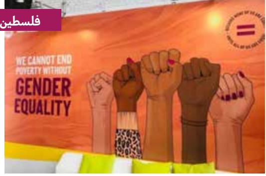
مشروع التعاون الإيطالي في فلسطين. بمناسبة اجتماع في الحملة التي استمرت ١٦ يومًا