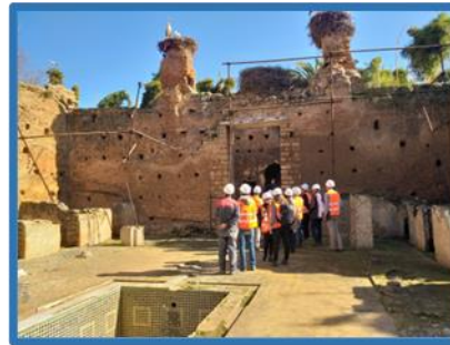
Chantier des travaux