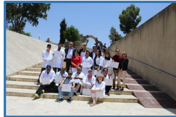
Formation vestiges archéologiques