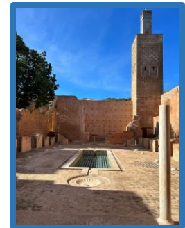
Medersa Mérinide restaurée