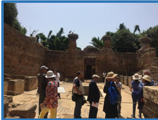
Formation monuments architecturaux

Cette formation s'ajoute à celle effectuée à Chellah, concernant la restauration des monuments architecturaux , à laquelle ont participé des fonctionnaires du Ministère de la Culture et des responsables pour la supervision des restaurations du patrimoine architectural et archéologique marocain.