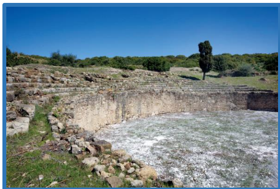
Amphithéâtre à restaurer