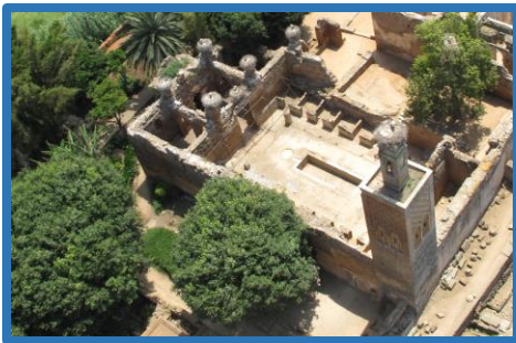
Vu aérienne de la Medersa Mérinide avant la restauration