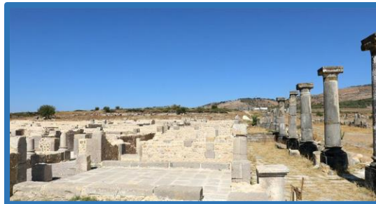
Partie du Palais de Gordien après la restauration