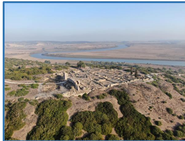
Vu aérienne du site