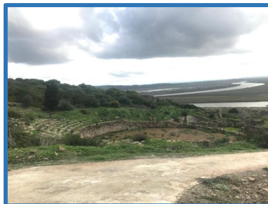
Circuit de visite